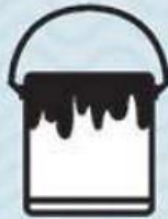
PEINTURES & SOLVANTS