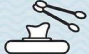
LINGETTES & COTON-TIGES