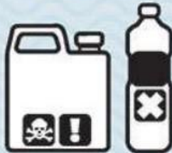
PRODUITS TOXIQUES / PHYTO-SANITAIRES