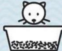
LITIÈRE POUR CHAT